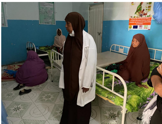
Besichtigung eines MCH.