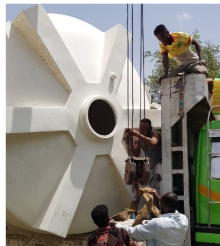
Aufbau des Wassertanks am EAUH.

Die Wasserversorgung am Edna Adan University Hospital ist 20 Jahre alt und marode. Auch war der vorhandene Wasservorrat bei weitem ungenügend. In einer ersten Etappe installierten wir grosse Bodentanks, Drucktanks auf den Dächern und ein elektrisches Steuerungssystem. Dazu schlossen wir mit der liefernden Firma einen Wartungsvertrag ab. 2022 werden wir alle WCs, Waschbecken und schadhafte Leitungen erneuern. Damit kann der grosse Wasserverlust im System Ednas gestoppt werden.