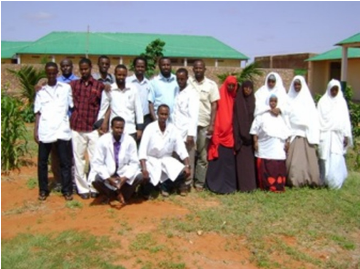
Aufnahme der gesamten Teams von Hadia Medical Swiss-Somalia in Abudwak vor dem Spital – leider immer noch mit einem einzigen Arzt unter ihnen.