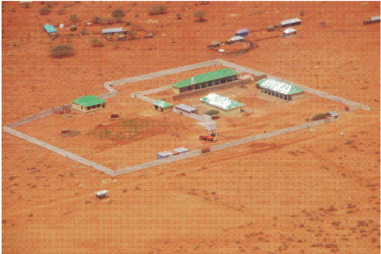
Die im Jahresbericht beschriebene Spitalanlage aus der Luft aufgenommen. So funktioniert die Aufnahme der Patientinnen und Patienten im Spital.