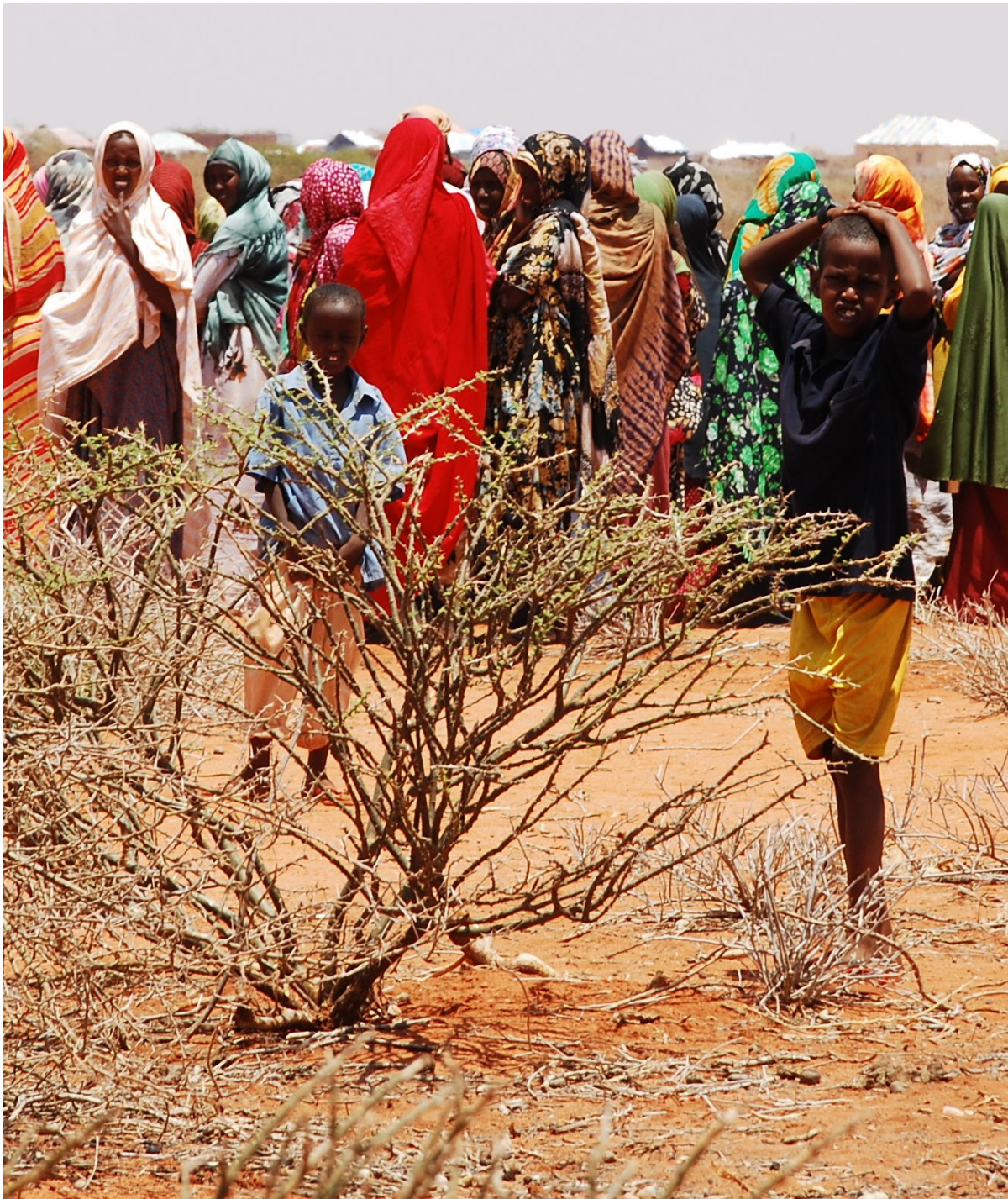
Kinder und Frauen in einem Flüchtlingslager in der Umgebung von Abudwak, Zentralsomalia. Hadia Medical Swiss-Somalia bringt nicht nur der alleingelassenen Bevölkerung ärztliche Hilfe und Wasser, sondern auch diesen Bewohnerinnen von Hütten aus durren Zweigen, Tüchern und Plastik.